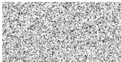
Razítko a podpis posuzujícího lékaře